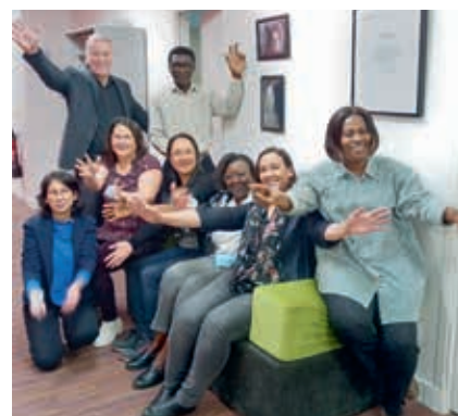
L'équipe du siège

Les fonctions support sont présentes au siège social de l'association : service comptable, facturation, service paie et ressources humaines (RH) et aussi au sein des établissements (RH, secrétariats...).