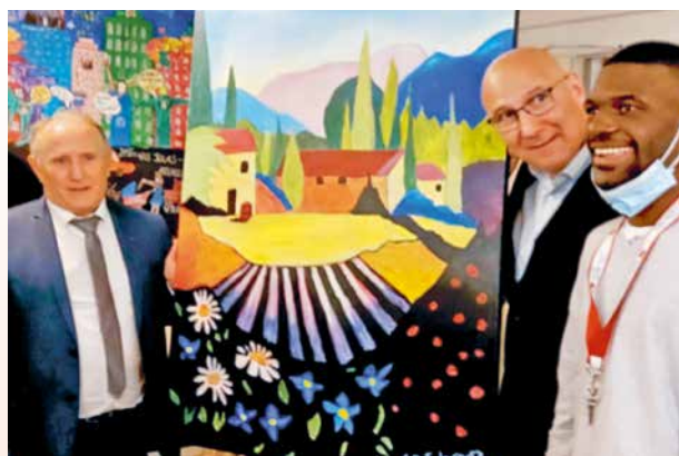
Monsieur le Maire et le cadeau offert par les résidents.