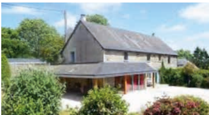
Gîte du calvados