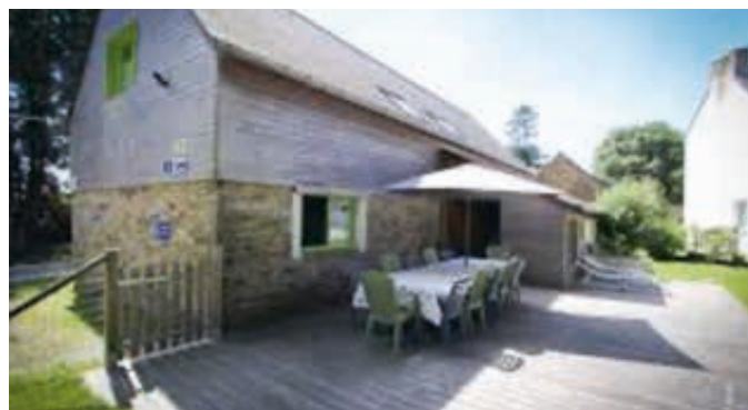
Gîte en Bretagne