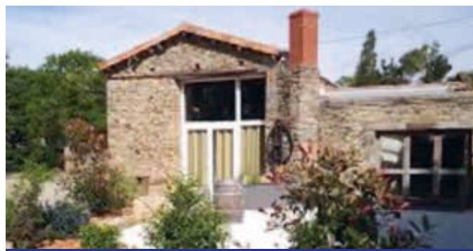
Gîte en Vendée

Pour les personnes souhaitant s'inscrire pour un séjour, quelques places sont encore disponibles. Comme chaque année, les animateurs feront découvrir de nouvelles activités afin que les participants en gardent de bons souvenirs.