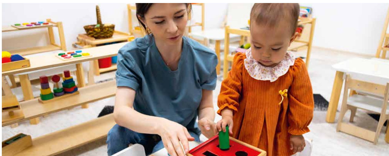
illustration par la présentation de l'outil d'évaluation COMVOOR

Le CAMSP (centre d'action médico-sociale précoce) de Paris-Nord a ouvert en 2005 et est géré par l'association Les Jours Heureux depuis 2019. L'établissement accueille des enfants de la naissance à six ans, présentant des décalages dans leurs acquisitions et/ou des fragilités développementales. Il peut s'agir de handicap moteur, mental, sensoriel ou d'un risque de handicap. Son action se situe dans une perspective de prévention, de dépistage et d'accompagnement, tant thérapeutique que social. Pour ce faire, l'équipe est pluridisciplinaire : psychomotricien.ne.s, orthophonistes, édu-