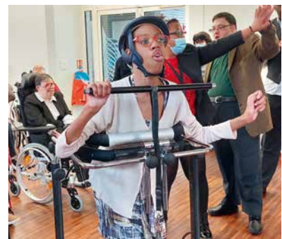
Aminata commence à s'échauffer